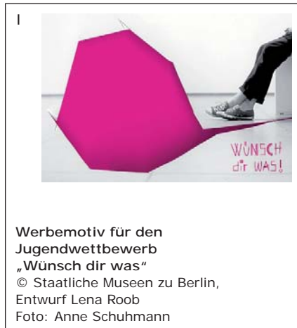
Werbemotiv für den Jugendwettbewerb „Wünsch dir was“ © Staatliche Museen zu Berlin, Entwurf Lena Roob Foto: Anne Schuhmann

Pressefotoanfragen pressebilder@smb.spk-berlin.de