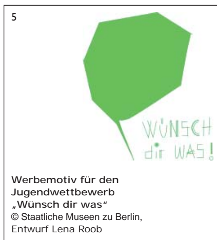
Werbemotiv für den Jugendwettbewerb „Wünsch dir was“ © Staatliche Museen zu Berlin, Entwurf Lena Roob