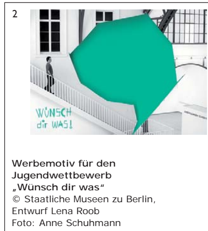
Werbemotiv für den Jugendwettbewerb „Wünsch dir was“ © Staatliche Museen zu Berlin, Entwurf Lena Roob Foto: Anne Schuhmann