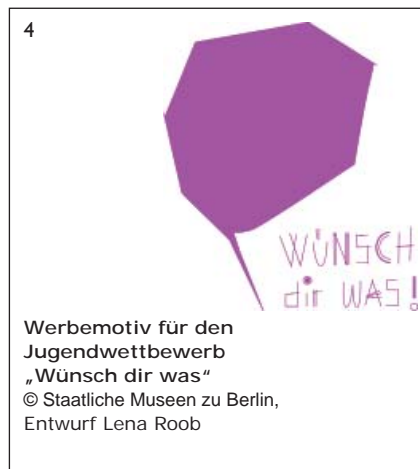
Werbemotiv für den Jugendwettbewerb „Wünsch dir was“ © Staatliche Museen zu Berlin, Entwurf Lena Roob