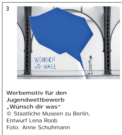
Werbemotiv für den Jugendwettbewerb „Wünsch dir was“ © Staatliche Museen zu Berlin, Entwurf Lena Roob Foto: Anne Schuhmann